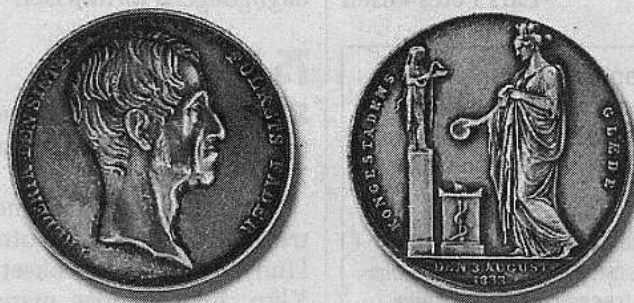
Medaljen, der efter mange ændringer, blev slået i glæden over konges helbredelse efter en alvorlig influenza i 1833. Den er fremstillet i legeringen Neu Platina og hvor Thorvaldsens buste af kongen danner forsidemotiv. Bagsidens motiv viser kvinde med murkrone ofre til Hyggæa foran et brændende alter med en æskulapstav.

formår Andersson med numismatikken som grundlag i en interessant og let læselig bog at beskrive det kul-